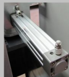
Equipamento pneumático de 1a. linha